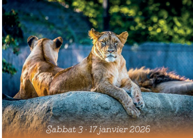
Sabbat 3 · 17 janvier 2026