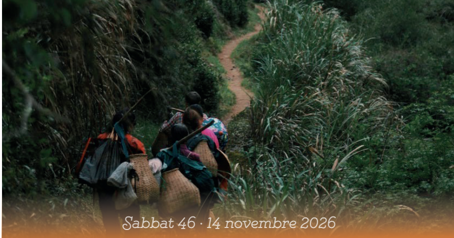
Sabbat 46 · 14 novembre 2026