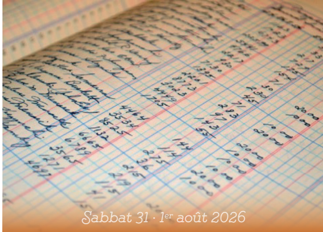
Sabbat 31 · 1 er août 2026