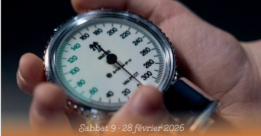
Sabbat 9 · 28 février 2026