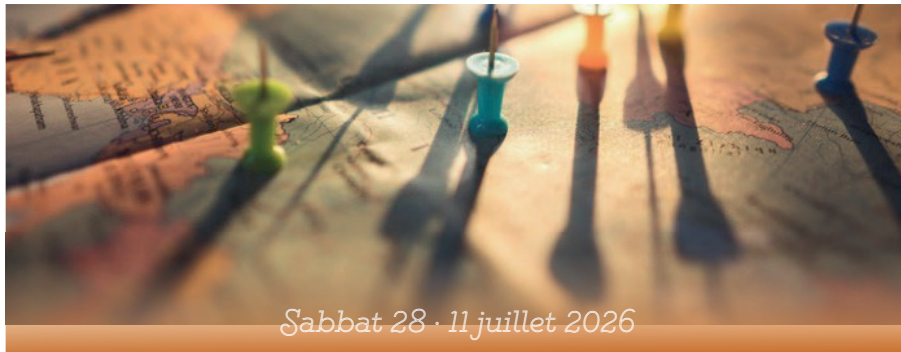
Sabbat 28 - 11 juillet 2026

(Après la bénédiction, la congrégation se recueille un instant, tandis que les officiants descendent de l'estrade pour la saluer à la porte)